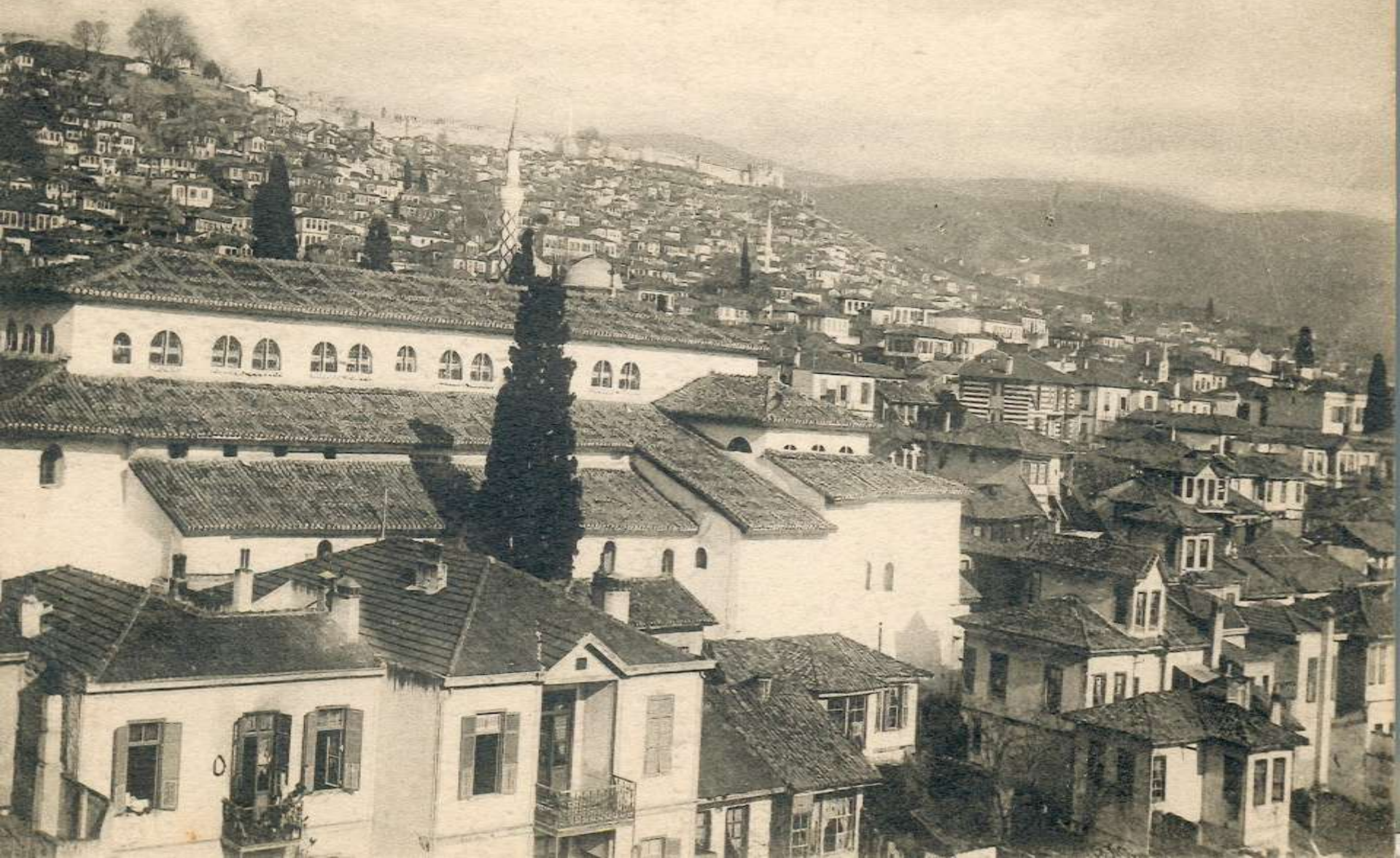
91. - SALONIQUE. - Vue Panoramique